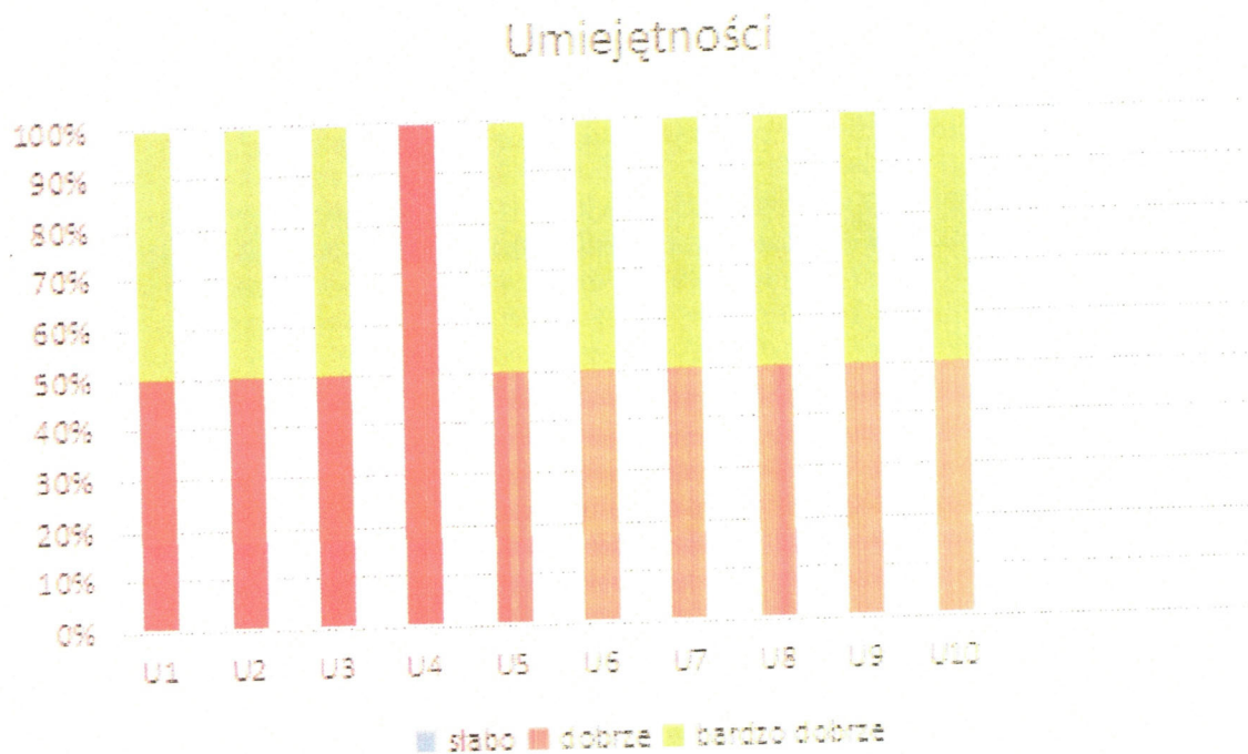
Ryc. 2. Stopień opanowania efektów kształcenia w zakresie umiejętności przez absolwentów studiów I stopnia, kierunek Geografia